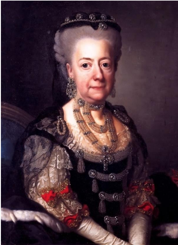
Änkedrottning Lovisa Ulrika (daterad 1775) Alexander Roslin (1718-1793)