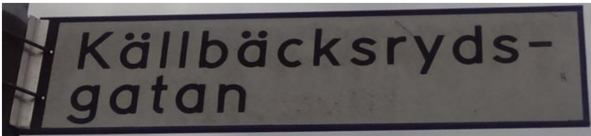
Källbäckeryds-gatan med tvärgatorna Käll-, Bäck- och Rydsgatan verkar vara det enda, som minner om kronohemmanet Kiällebäcksryd i Brämhults socken.

Möjligen var urfadern Anders efternamn Larsson, då en förmodad son Lars Andersson från Kiällebäck (gift 1662), som alltså kan ha varit storebror till Sven Andersson (gift 1668), fick flera barn där åren 1663-1671.