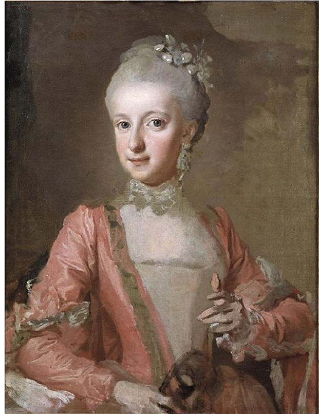
Prinsessan Sophia Albertina Lorens Pasch den yngre (1733-1805)